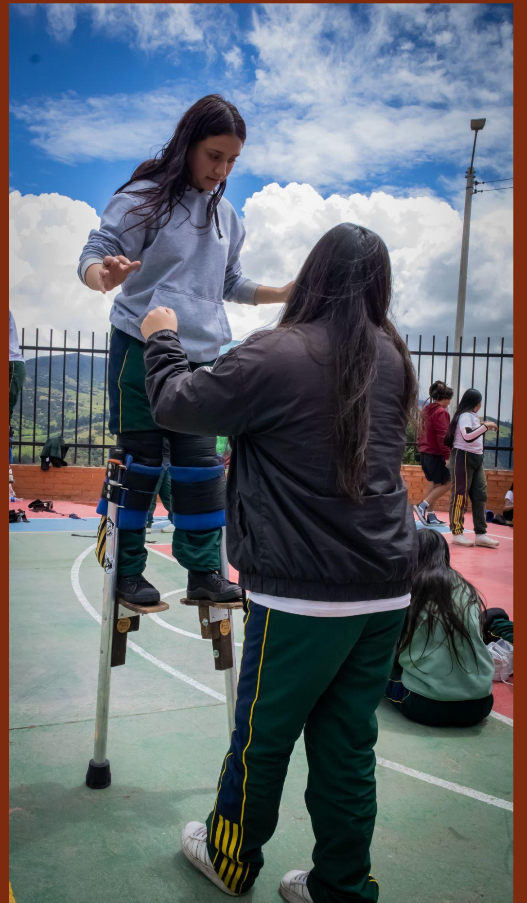
Taller de Iniciación Festiva / Circo, Botucada y Zancos