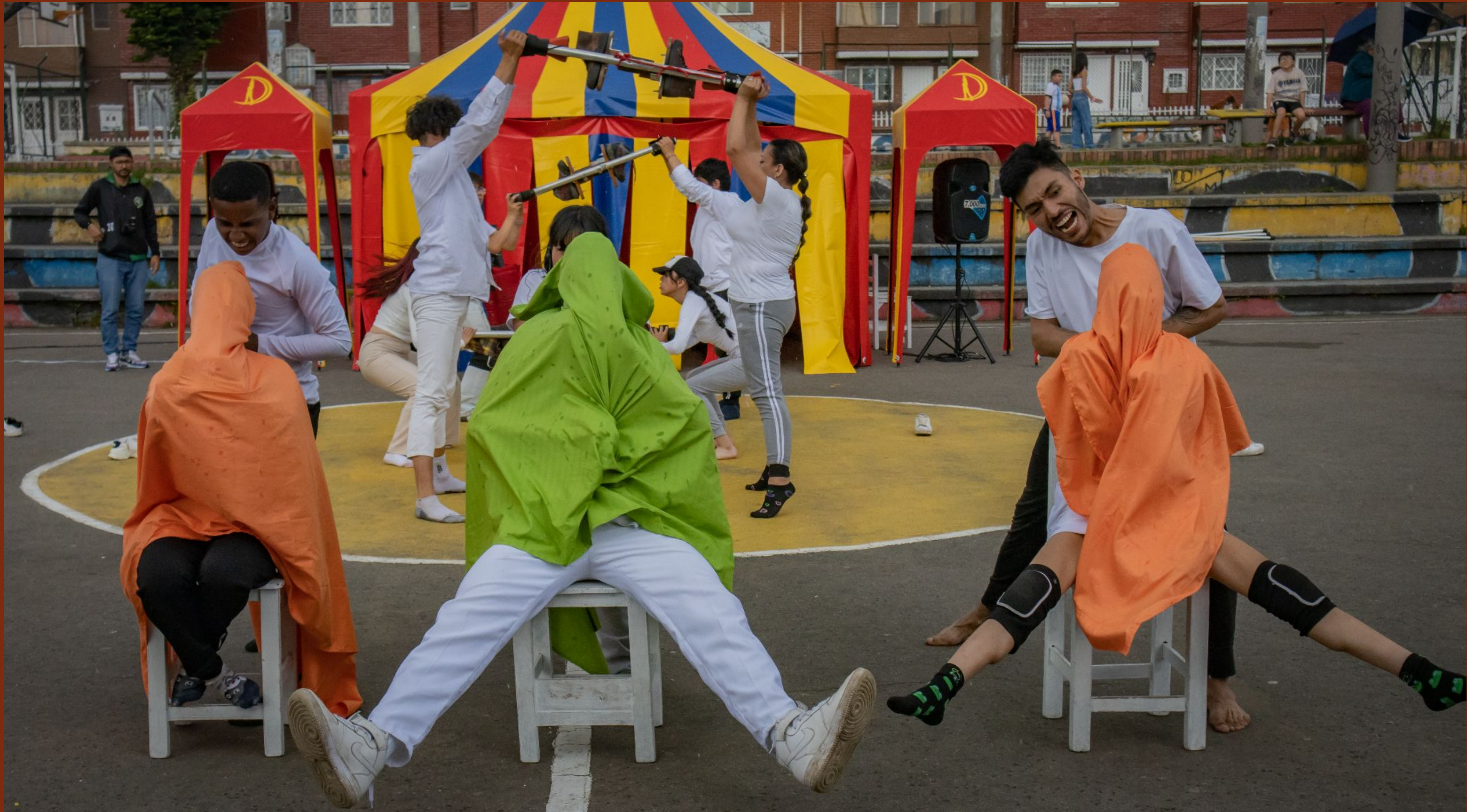
Muestra de saberes