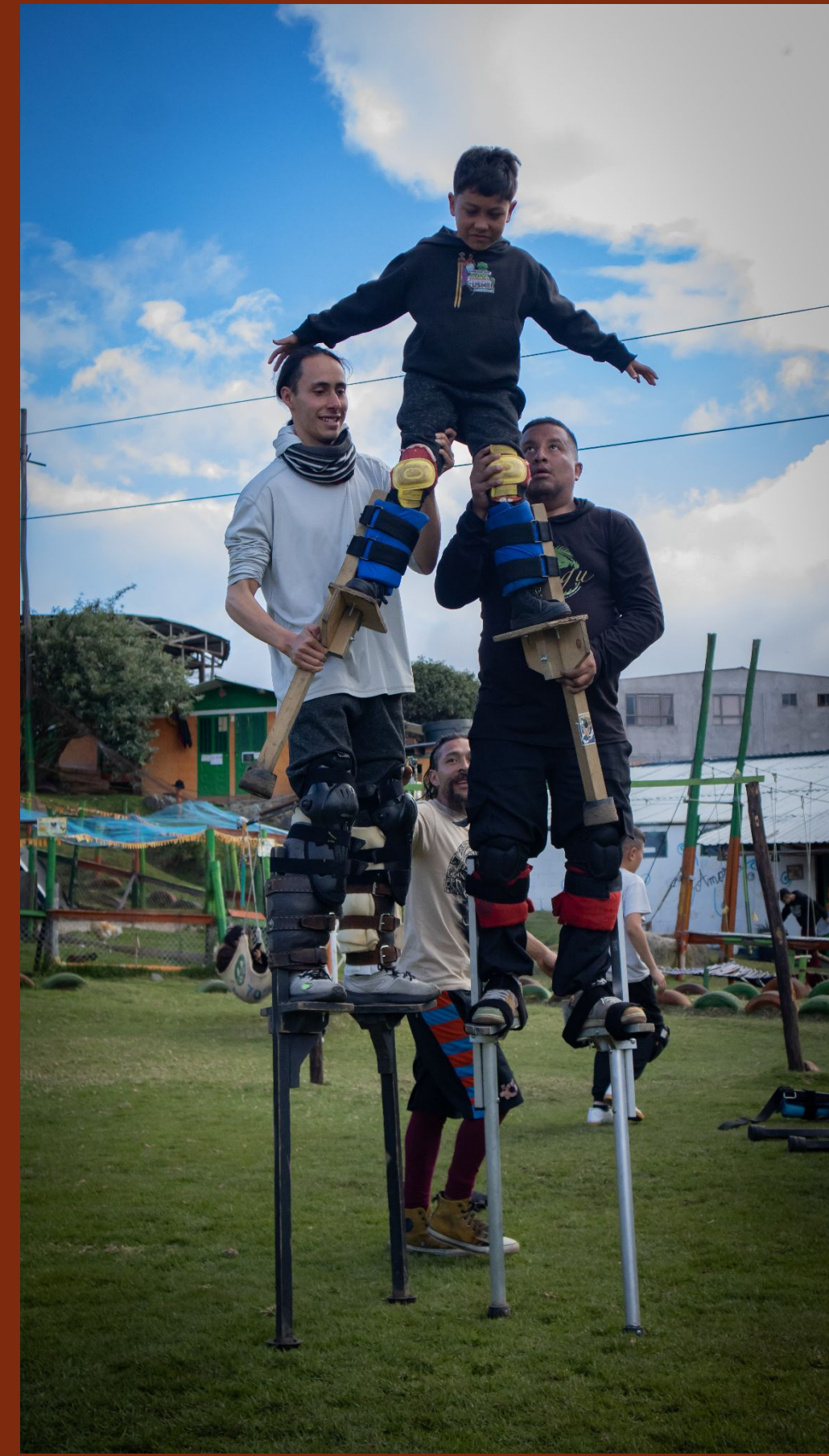
Encuentro de Saberes